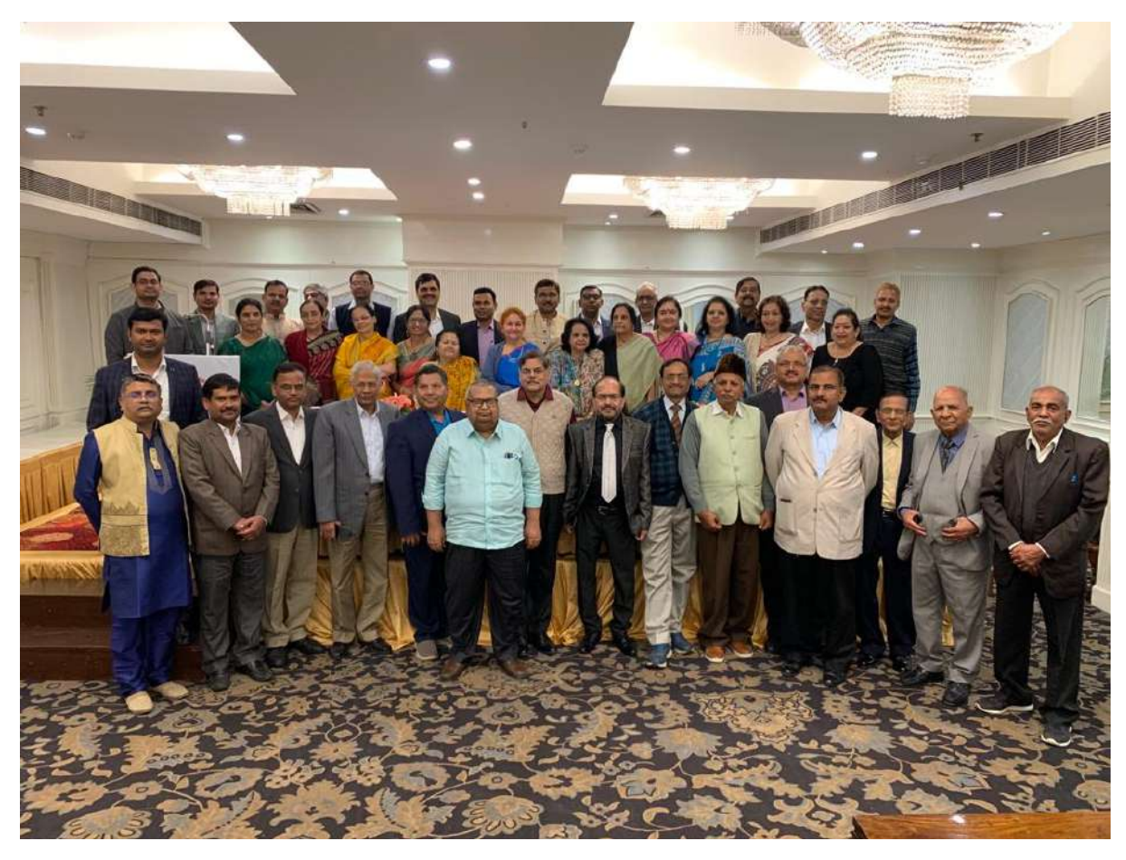
Videos on YouTube https://youtu.be/LyVu4rM0VIU